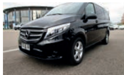
Mercedes Vito Long